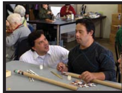
Em visita à ADERE (Associação para Desenvolvimento, Educação e Recuperação do Excepcional).