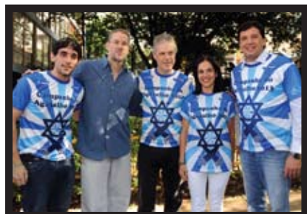
Com a primeira-dama do Estado, Lu Alckmin, durante campanha do agasalho na Praça Vilaboim, em Higienópolis.