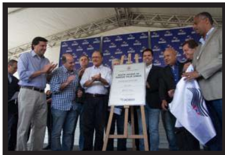
Com o Governador Geraldo Alckmin na inauguração do posto do ACESSA SP no Parque Villa Lobos e início das obras do Parque Ecológico Cândido Portinari.