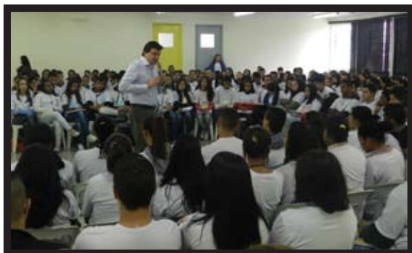
Ministrando palestra aos alunos do curso de capacitação profissional da UNIBES.