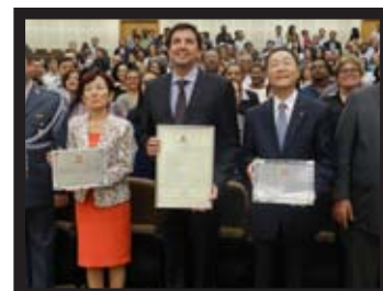
Sessão Solene em homenagem a SGI - Soka Gakkai Internacional.