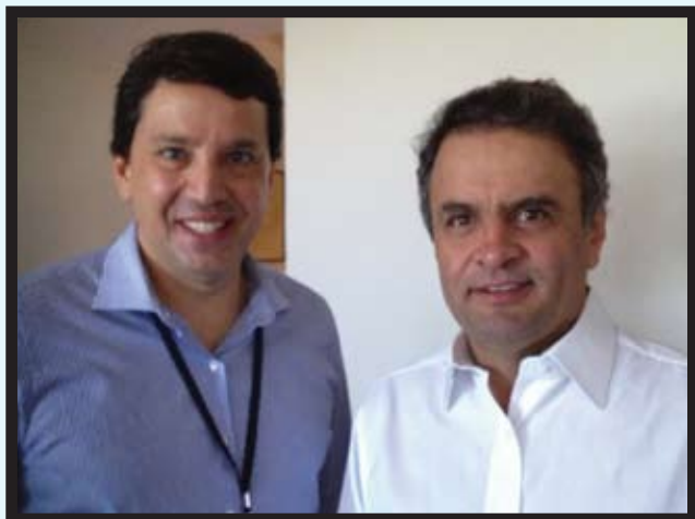
Floriano com o novo presidente do PSDB, Aécio Neves.

No dia 18 de maio, mais de quatro mil militantes do PSDB se reuniram em Brasília para a Convenção Nacional, que elegeu o novo presidente e a executiva nacional. O senador Aécio Neves (MG) foi eleito presidente, com 521 dos 535 votos dos delegados.