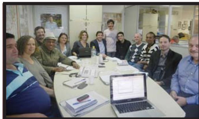
No gabinete, em reunião com artistas de rua.