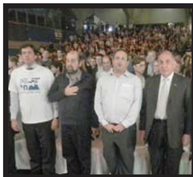
Floriano na Hebraica, em evento que homenageou o soldado israelense Gilad Shalit.