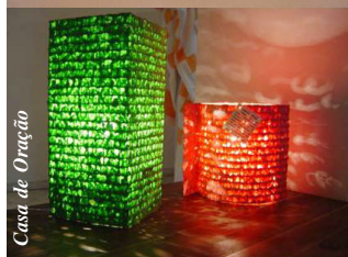
Casa de Oração