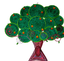
Oficina de Arte Boracea

A Lei 14.949/09 que institui a Rede de Comércio Solidário na Cidade de São Paulo proporcionará geração de renda e inclusão social. Beneficiará organizações das quais fazem parte jovens, adultos, idosos, pessoas com deficiência, mulheres vítimas de violência, famílias e pessoas usuárias dos diversos serviços da rede em parceria com organizações sociais.