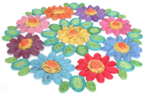
Oficina de Arte Boraceia