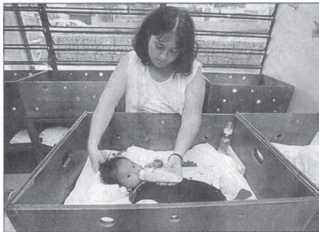
NA CRECHES municipais são aceitas crianças de 0 a 3 anos